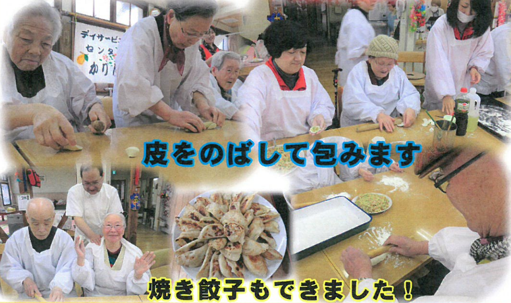
焼き餃子もできました！